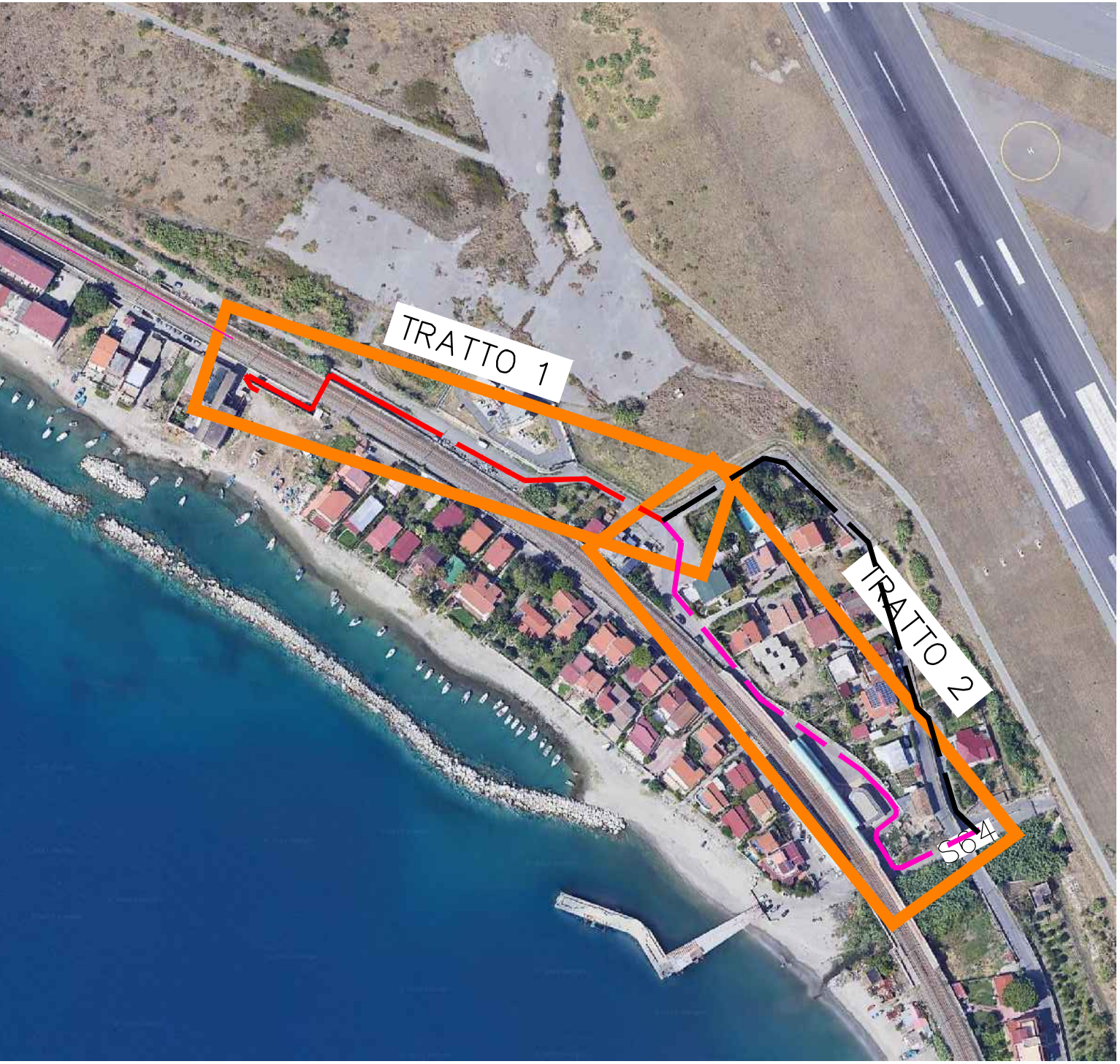
PIANTA CHIAVE 1:2500